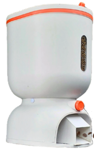
Alat Pemberi Pakan Otomatis